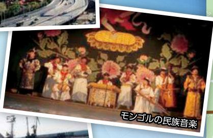
モンゴルの民族音楽