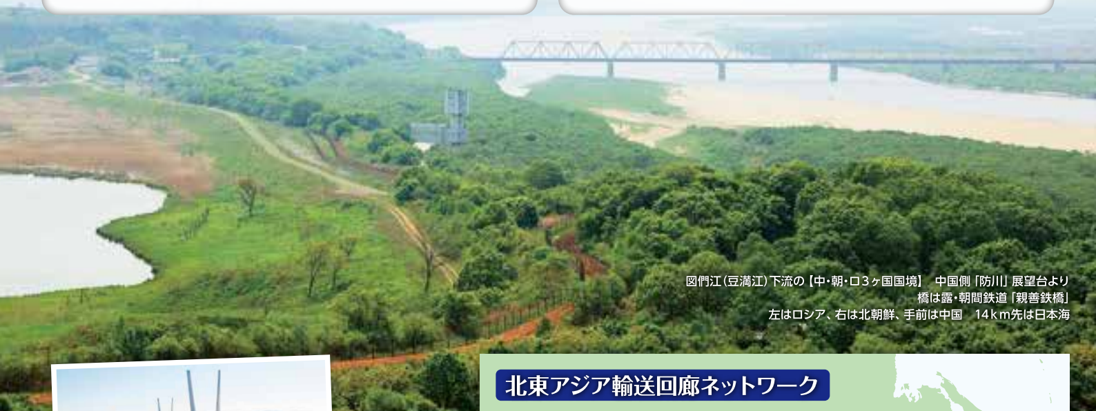
図們江(豆満江)下流の【中・朝・ロシア3ヶ国国境】 中国側「防川」展望台より 橋は露・朝間鉄道「親善鉄橋」 左はロシア、右は北朝鮮、手前は中国 14km先は日本海