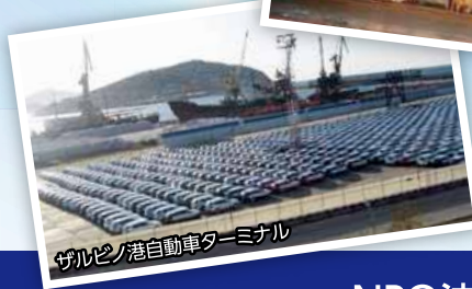
ザルビノ港自動車ターミナル