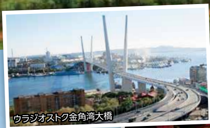
ウラジオストク金角湾大橋