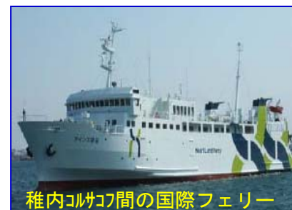
稚内コルサコフ間の国際フェリー