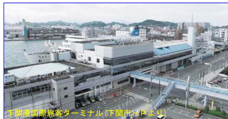
下関港国際旅客ターミナル(下関市HPより)